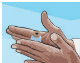
Stap 8: draai de flacon voorzichtig door een cirkelbeweging te maken met de handen