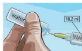
Stap 6: trek steriel water op