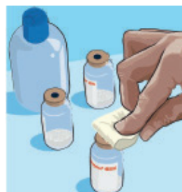
Stap 4: ga aseptisch tewerk