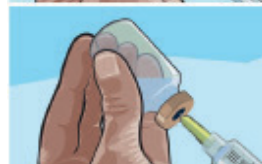
Stap 13: wanneer het product wordt opgetrokken, mag het geen schuim bevatten