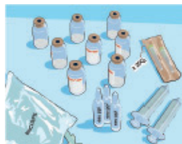
Stap 2: leg de benodigdheden klaar

– Poster voor de patiënt en het patiëntenzorgteam –